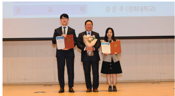
(KCS-Wiley 젊은화학자상 수상)