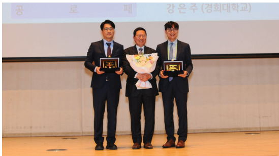
(Sigma-Aldrich 화학자상 수상)