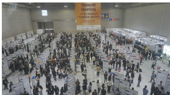
(포스터 발표 및 기기전시회)