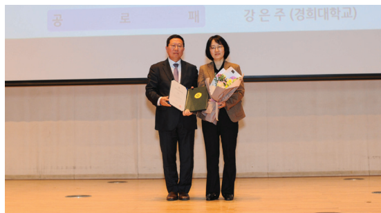
(아이센스 여성화학자상 수상)