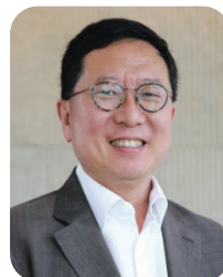
신 석 민 (대한화학회 회장)