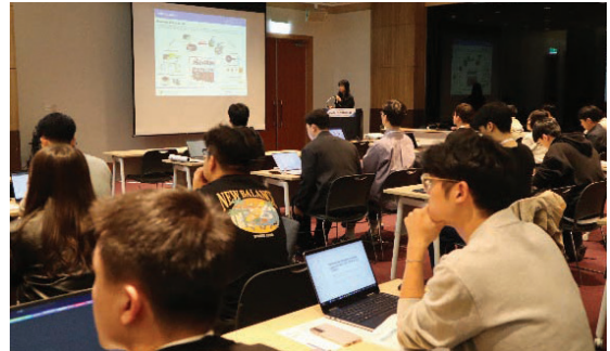
〈일반세션 및 특별세션〉