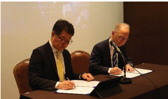
〈유럽세라믹학회 MOU 체결〉