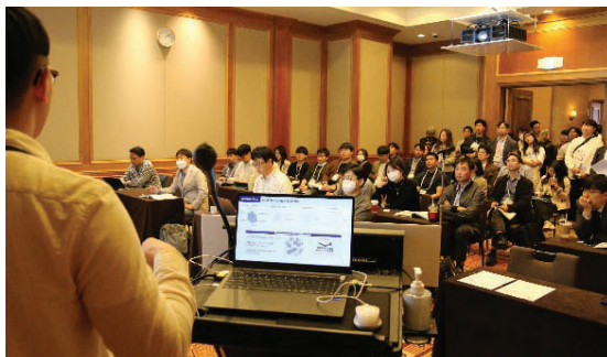
〈일반세션 및 특별세션〉